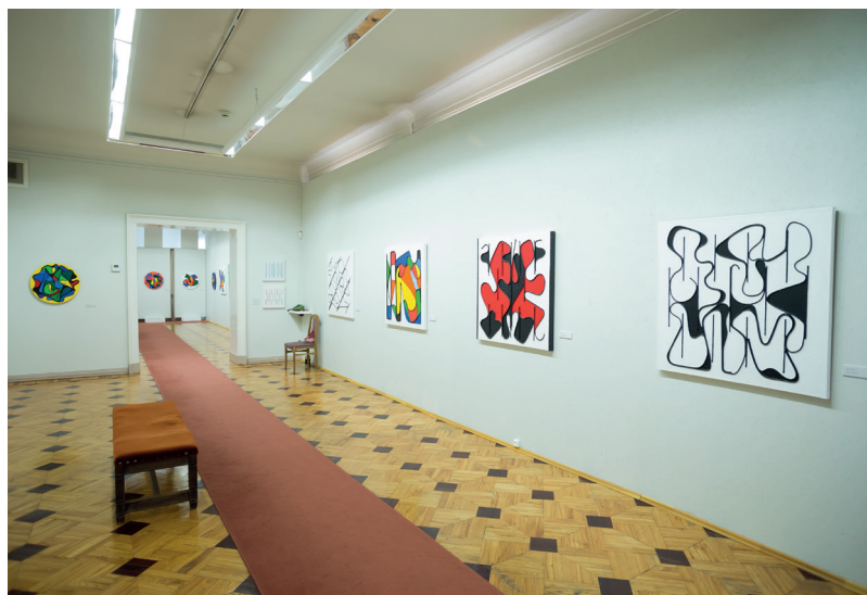
Ingrydos Suokaitės-Helmer grafikos ir tapybos parodos „Spalvų ribos“ fragmentas.