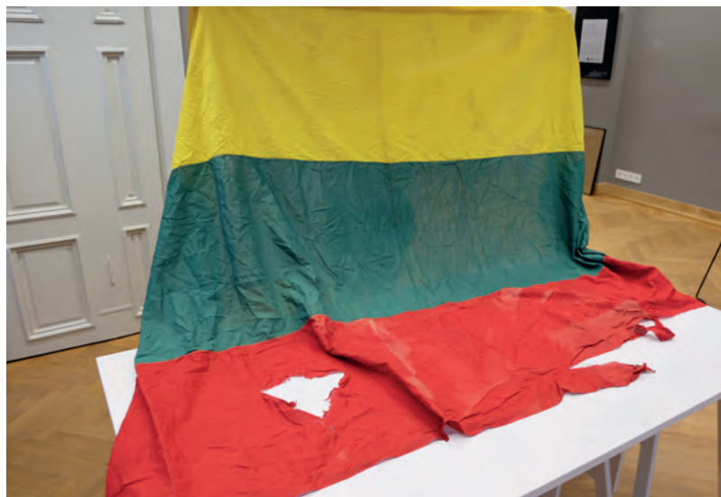
Lorenzo parapijos Trispalvė Prezidento Valdo Adamkaus bibliotekos- muziejaus ekspozicijoje prieš restauravimą.