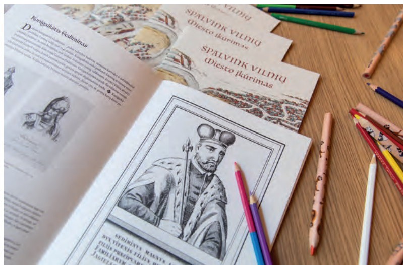
Sapusdintinė (tradicinė) spalvinimo knyga „Spalvink Vilnių: miesto įkūrimas“ (išleido Lietuvos dailės muziejus, 2018 m.).