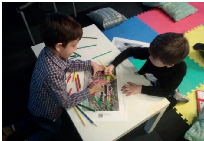
Edukacinio užsiėmimo, vykusio Kipro lietuvių bendruomenės mokyklėlėje 2019 m., akimirkos