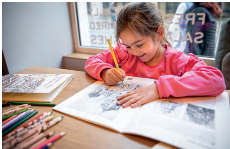
Vaikai spalvina spausdintinę ir interaktyvią spalvinimo knygą, 2019 m.