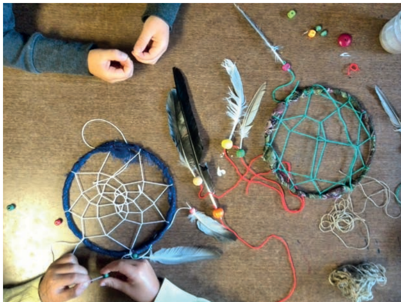
Užsiėmimas „Sapnų gaudyklė ir lazdukai“.