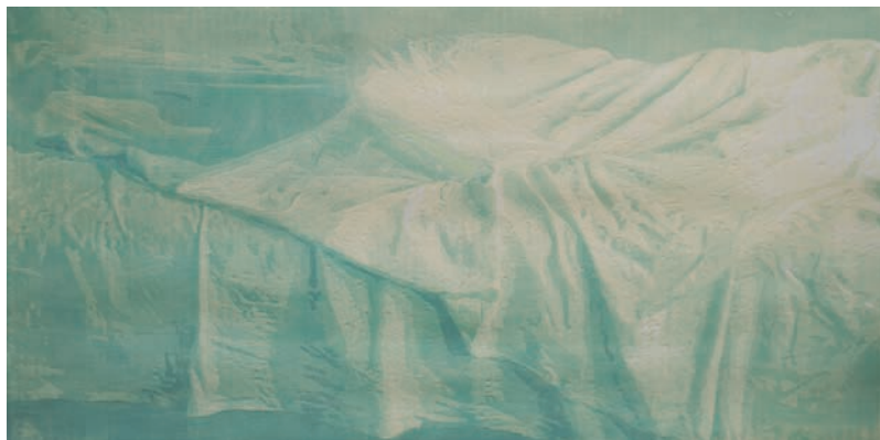
Laura Selmistraitytė Iš ciklo „Nieko neveikimas“. 2012 m.

Papierius, spalvotas medžio raižinys, 76x152 cm. Autorės nuosavybė.