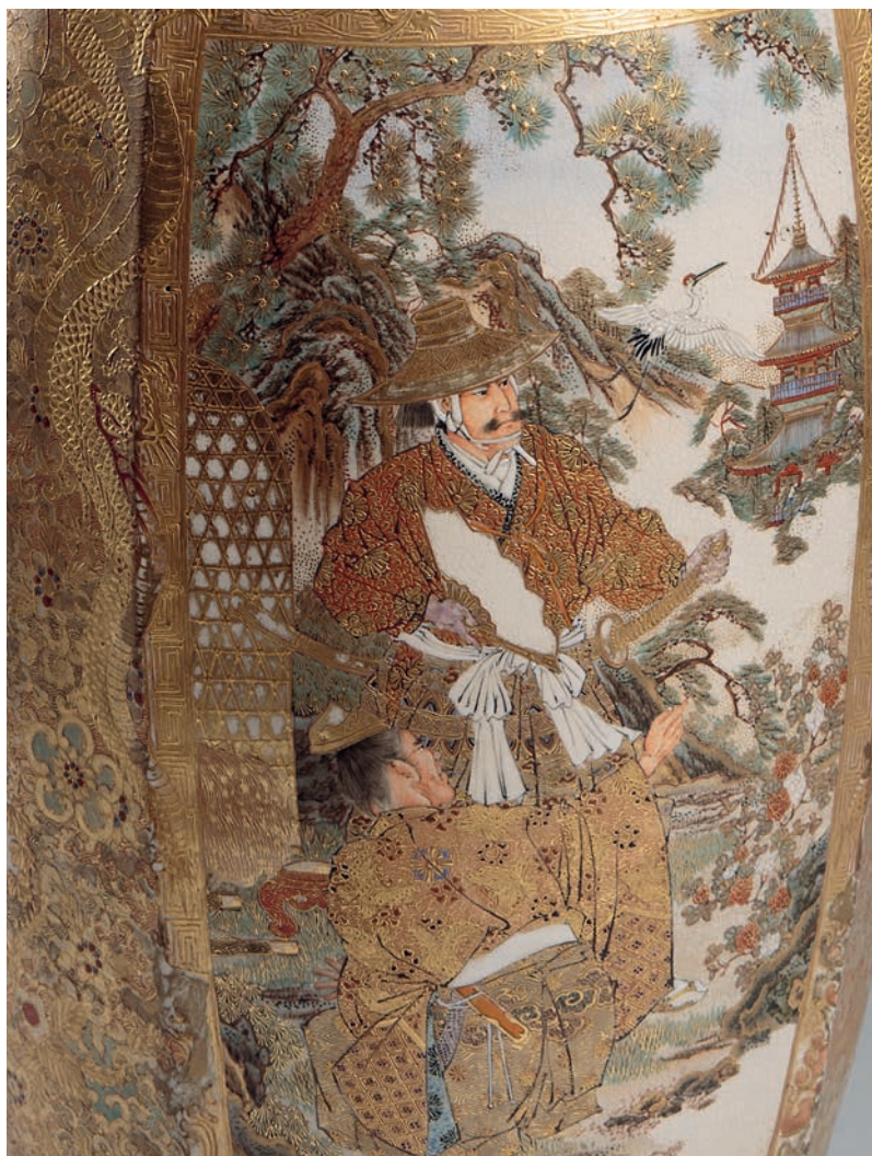
Satsuma vazos fragmentas. LDM ED-193203/2.

savitą japonų porceliano stilių reprezentuoja dvi prabangios XIX a. satsuma vazos. Šio porceliano gamyba Satsumos prefektūros Kiūšiū saloje prasidėjusi XVI a. pabaigoje, suklestėjo būtent XIX amžiuje. 1867 m. Satsumos porcelianas susilaukė didžiulio susidomėjimo Pasaulinėje parodoje Paryžiuje ir buvo pradėtas masiškai gaminti eksportui. Jo savitumas – smulkiai suaižėjusi kralė glazūra su reljefiniais įvairiaspalvio emalio ornamentais gausiai auksuotame fone; šoninės plokštumos dekoruotos detaliai ištapytomis mitologinių ir istorinių siužetų scenomis, peizažo elementais, samurajų, nacionaliniais kostiumais vilkinčių moterų figūromis. Muziejaus rinkinius dovanotoji kolekcija praturtino ir pora vertingų japonų drožybos pavyzdžių. Dramblio kaulo miniatiūrinė XIX a. skulptūrėlė „Senis su vėduokle“ reprezentuoja itin savitą japonų