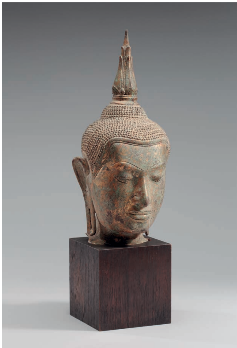
Budos galva. XVIII a. pab.–XIX a. pr., Bankokas (Tailandas).

Vario lydinio liejinys, auksavimo pėdsakai, 40x20x20 cm. LDM ED-193.248/a-b.