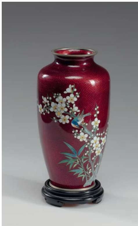
Vaza. XX a. II p., Kinija.

Vario lydinys, emalis, pertvarinis emalis, h – 22,5 cm, Ø (viršaus) – 7 cm, Ø (dugno) – 7,5 cm. LDMED-193.250.