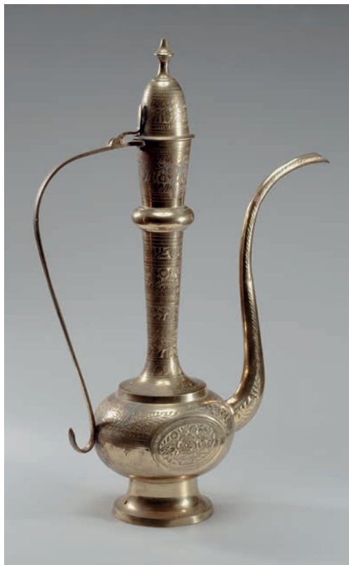
Arbatos indas. XX a., Indija (?).

Vario lydinys, valcavimas, kalstymas, graviravimas, liejimas, h – 55 cm, Ø (viršaus) – 6,3 cm, Ø (dugno) – 12 cm. LDM ED-193.223.