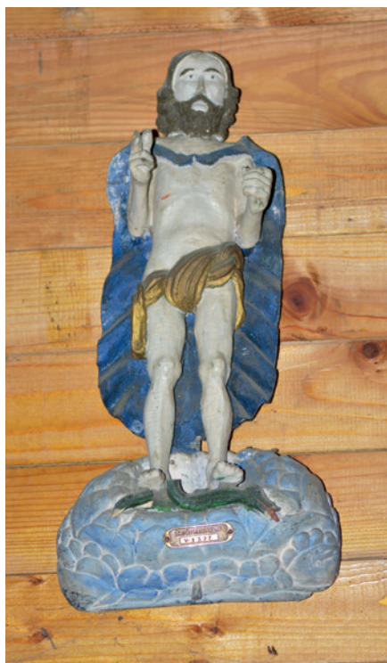
Paberžės bažnyčioje saugoma Prisikėlusį Kristų vaizduojanti skulptūra. 2015 m.