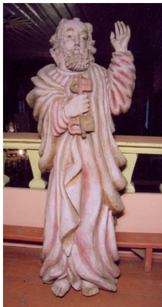
Vadaktėlių bažnyčioje saugoma šv. Petrą vaizduojanti skulptūra. 2006 m.