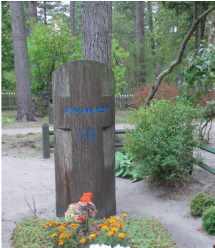
H. Blode'ės kapas senosiose Nidos kapinėse. 2015 m.