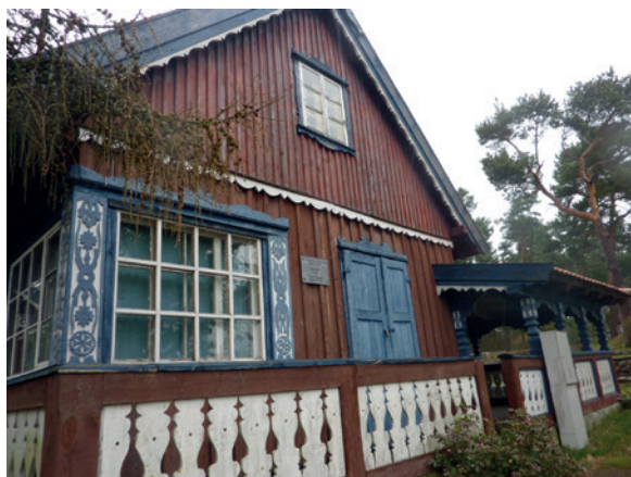
C. Knaufo namas Nidoje. 2012 m.