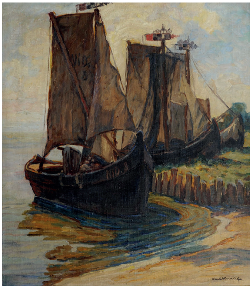
Carlus Knaufas. „Kurėnai marių pakrantėje“. 1930 m.

Drobė, aliejus, 74x65 cm. A. Popovo rinkinys, Nr. 145.