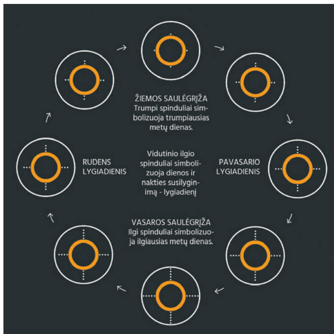
Schema, iliustruojanti dienos ilgumo kismą skirtingais metų laikais.