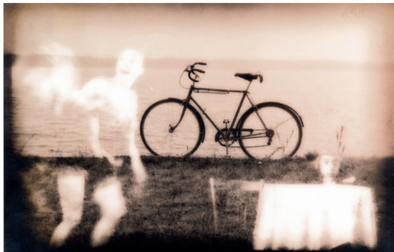
Gintautas Stulgaitis. „Pievoje“. 1987 m. LDM Fm 2740