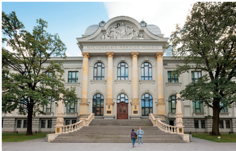
Latvijas nacionālais dailės muzejs.