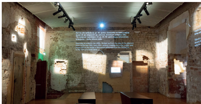
Ventspilio muzejūje.