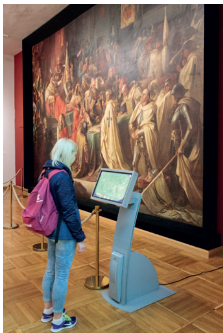
Torunės rotušės muziejuje.