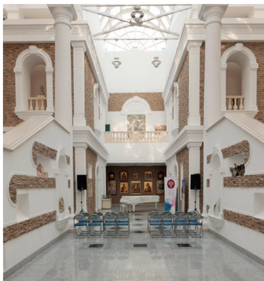
Baltarusijos nacionalinis dailės muziejuje.