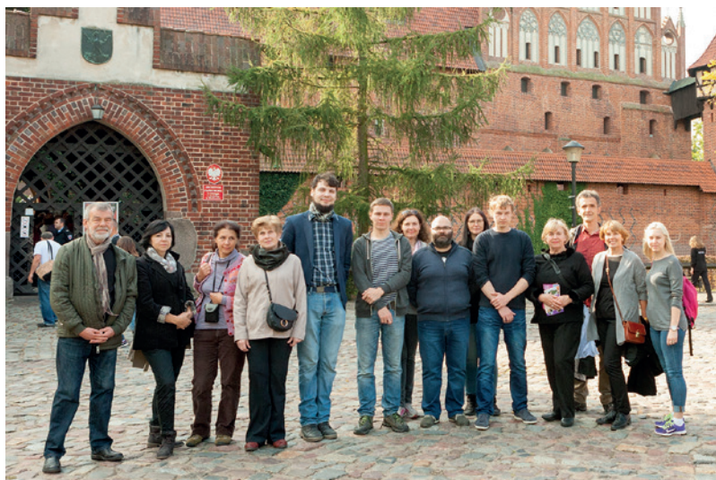
Seminaro dalyviai prie Malborko pilies.