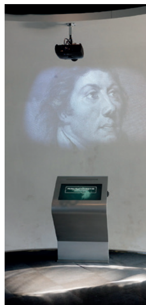
Nuotraukose – Gdanskio Emigracijos muziejaus ekspozicijos fragmentai.