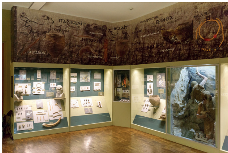
Baltarusijos istorijos muziejuje.