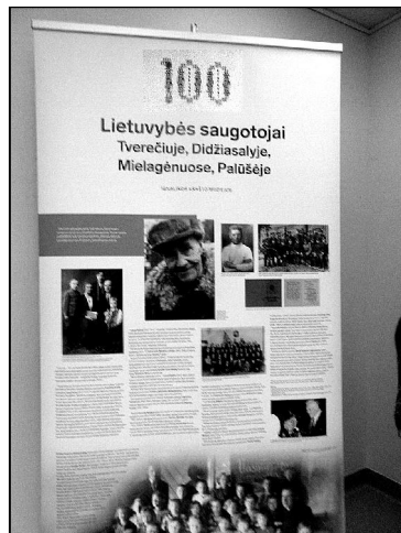
Stendas, skirtas Ignalinos kraštui.