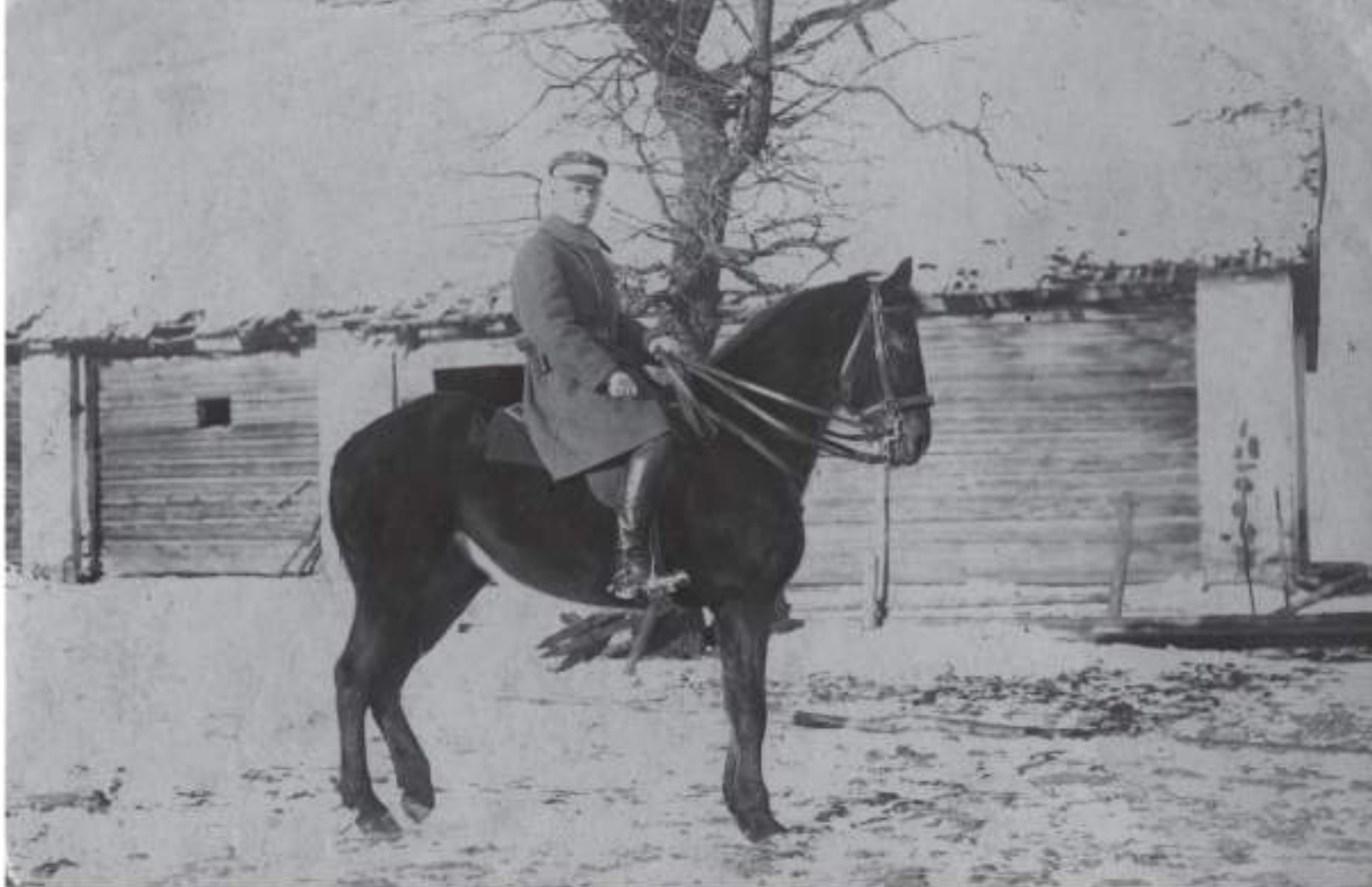
Pijus Dovydaitis Nepriklausomybės kovų su lenkais metu. Vieno apylinkės, 1921 m. Fotografijos nešnomos. LLBM PNH5