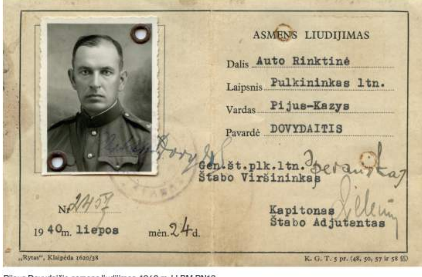
Pijus Dovydaičius armijos kurtinimas. 1940 m. LLBM PNH2