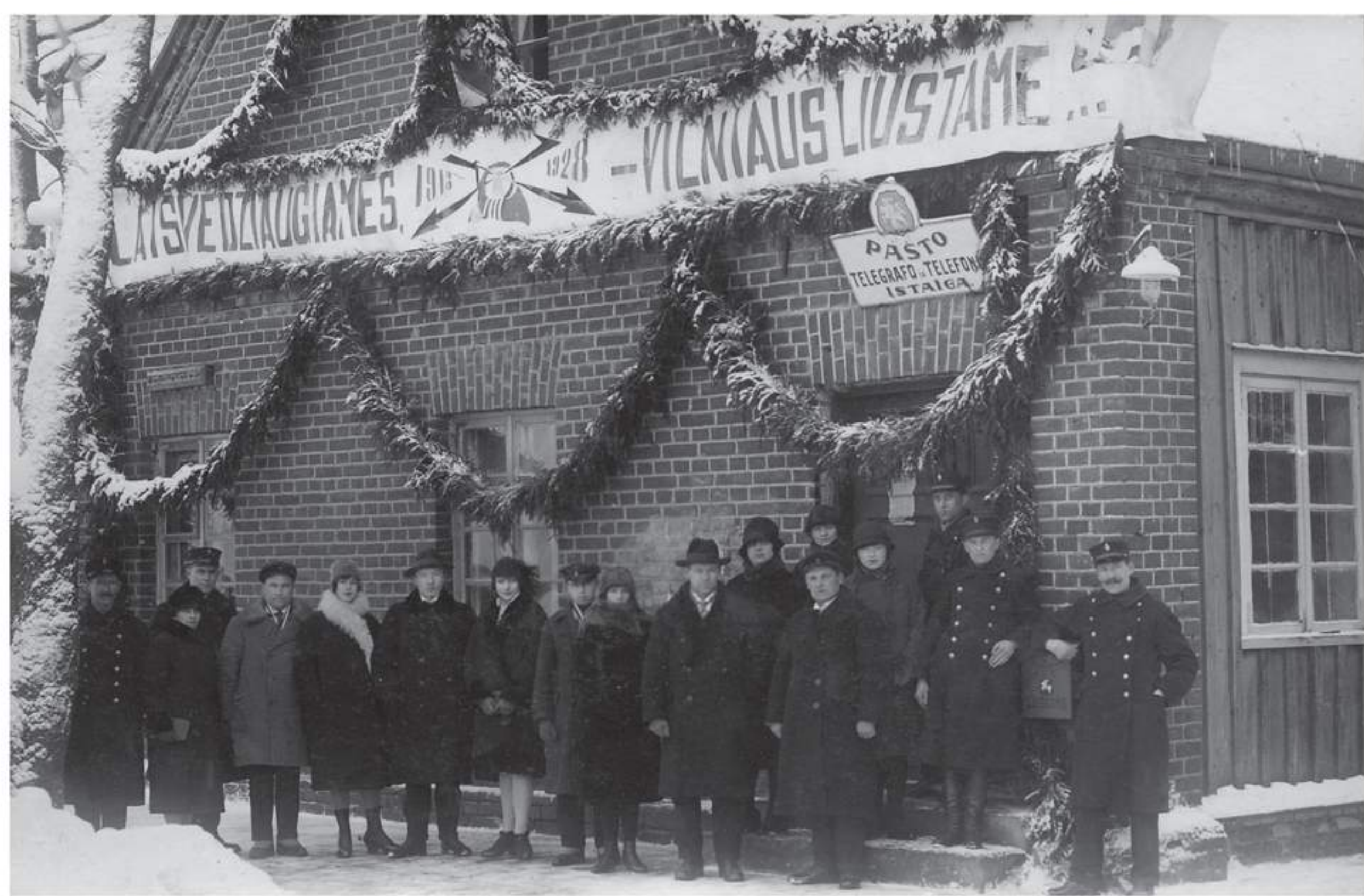
Rokiškio pašto darbuotojai, Lietuvos Nepriklausomybės 10-mečio progą nufotografavę prie pašto pastato. 1928 m. vasario 16 d.