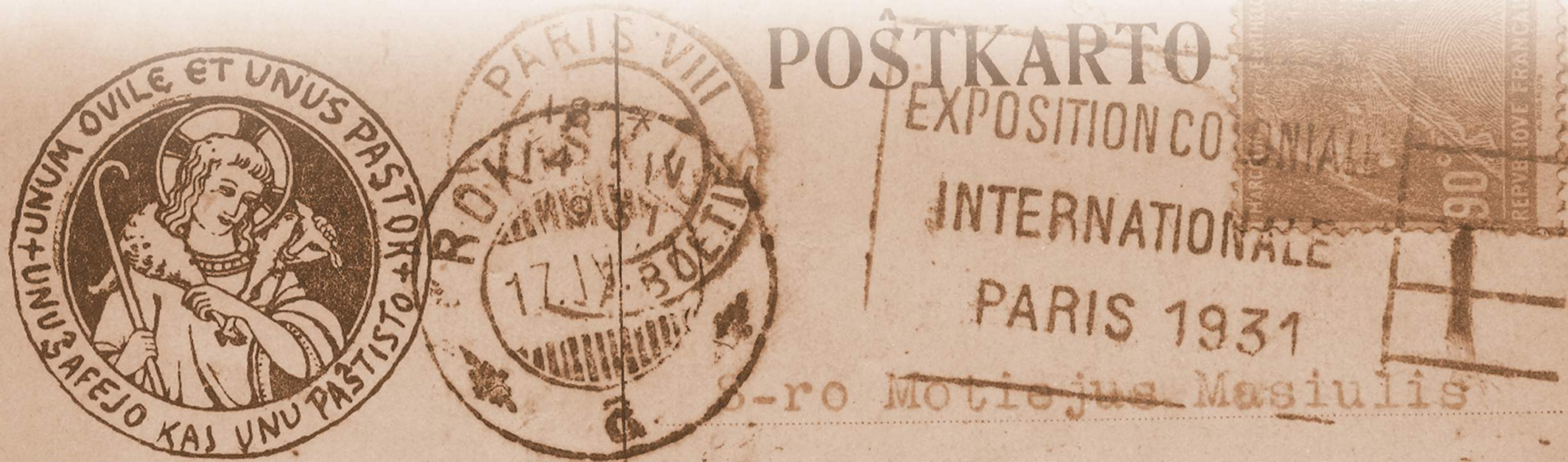
Aviatiškos Motiejai Masiulius, raištas esperanto kalba, suktas iš Paryžiaus 1931 m. RK56111

La plej malnova esperantlingva, la plej riĉe ilustrita kaj enhava revuo estas