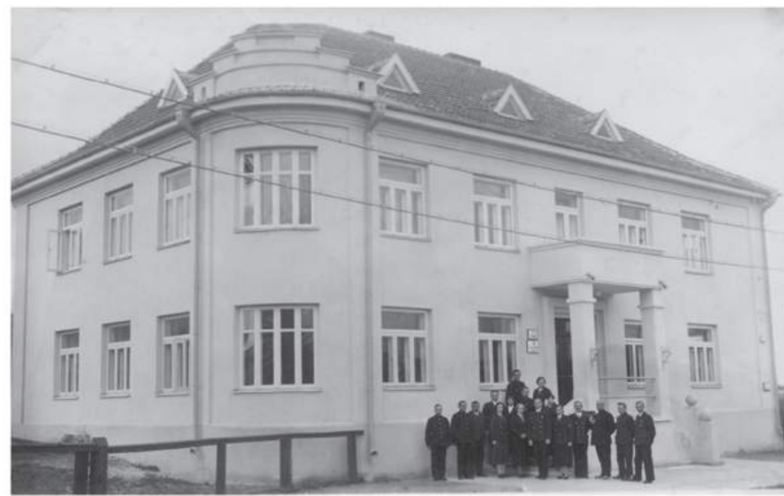
Rokiškio pašto naujasis rūmai. Lauke prie pastato stovi pašto darbuotojai. 1934 m. rugpjūčio 31 d. Fotografijos nešmenas. RKM-58024