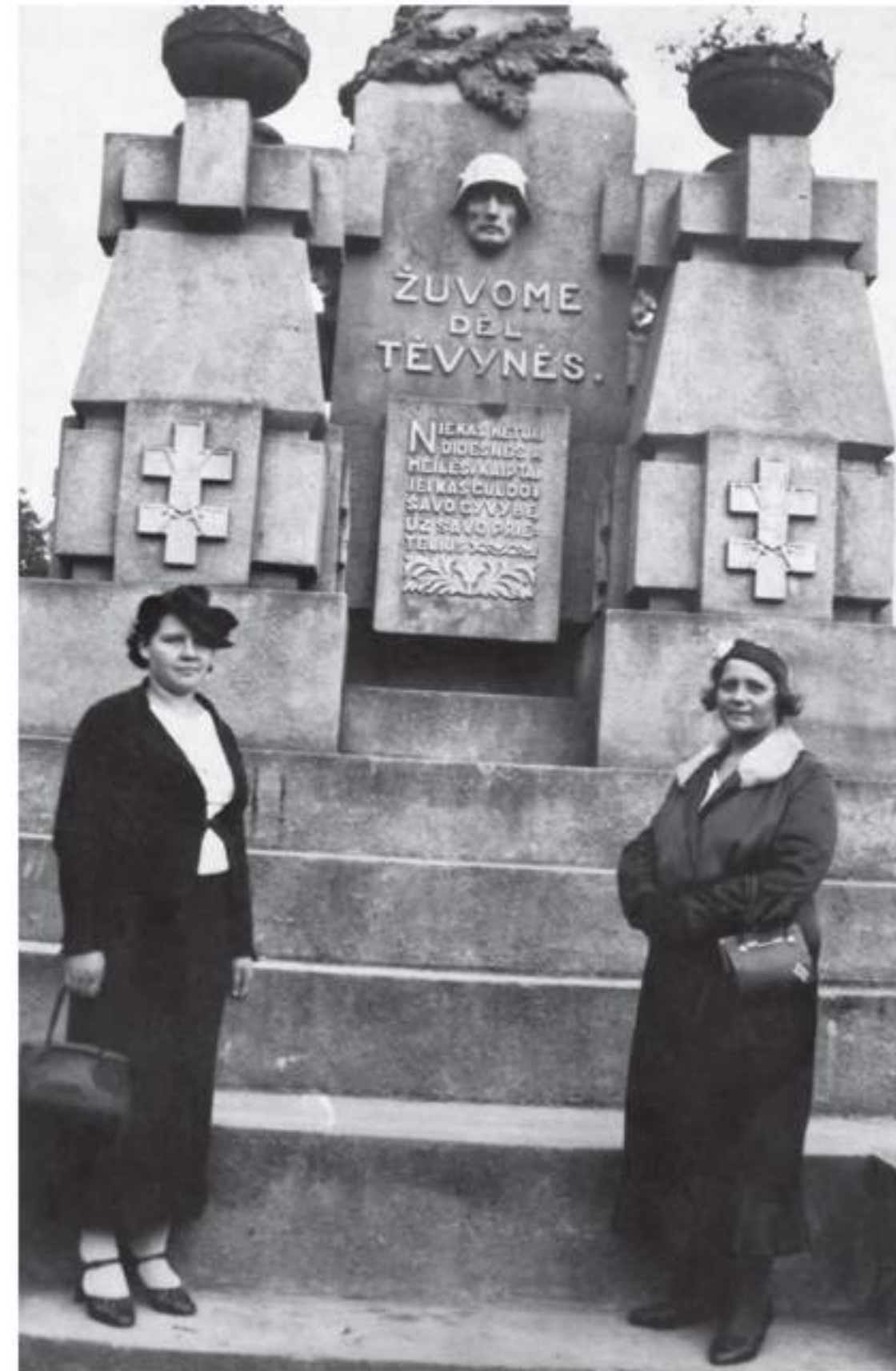
Fotografija. Paminklas „Žuomei dėl Tėvynės“, pastatytas 1920 m. Kauno kopinėse (dabar Ranybės parkas). Fotografijos nešimas. KDFM-F-13085