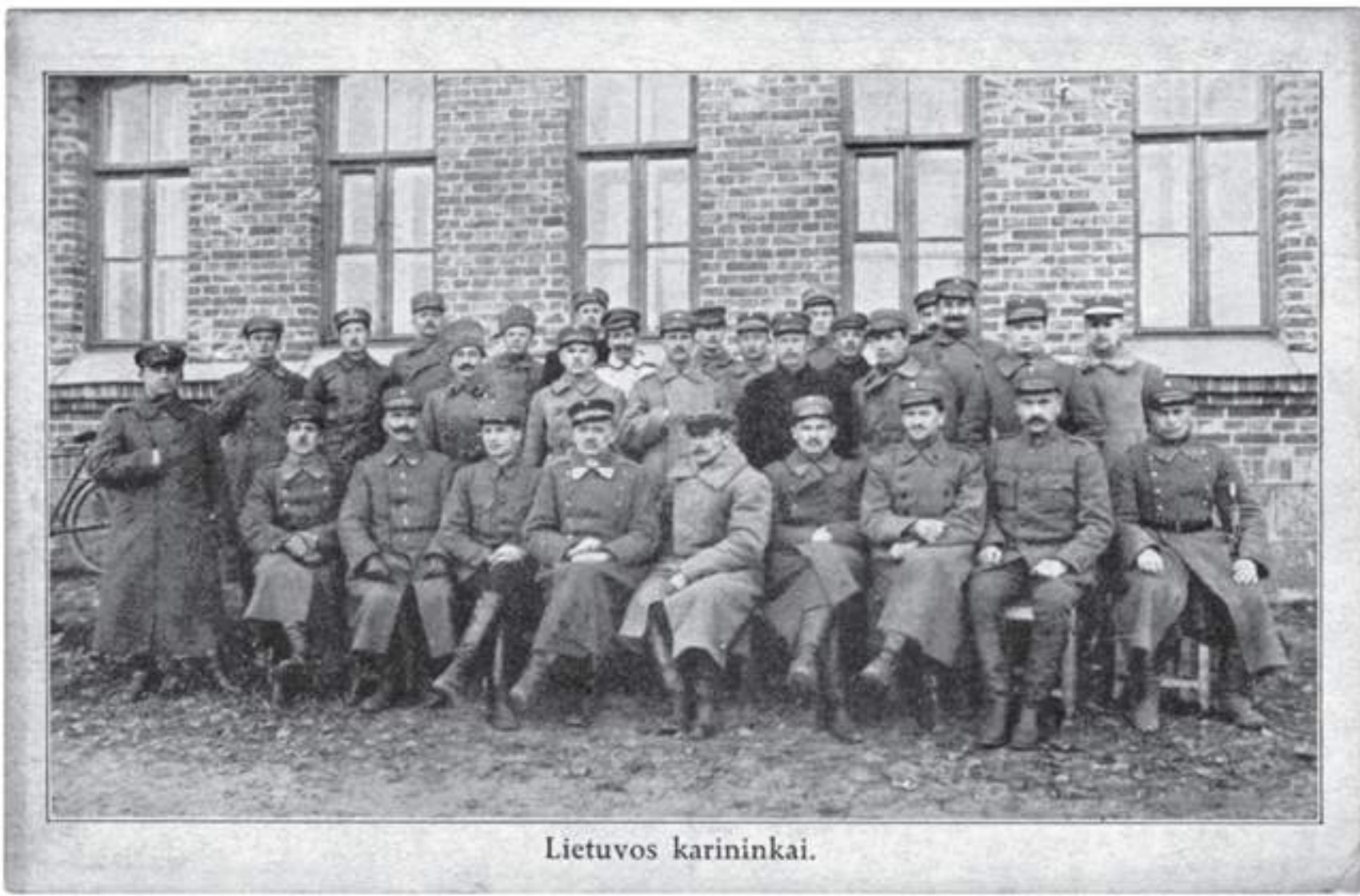
Atvirukė, Lietuvos Respublikos kariuomenės karininkai. Atvirukės išleistas apie 1919–1920 m. Fotografijos nešimas. KDFM-S-6276