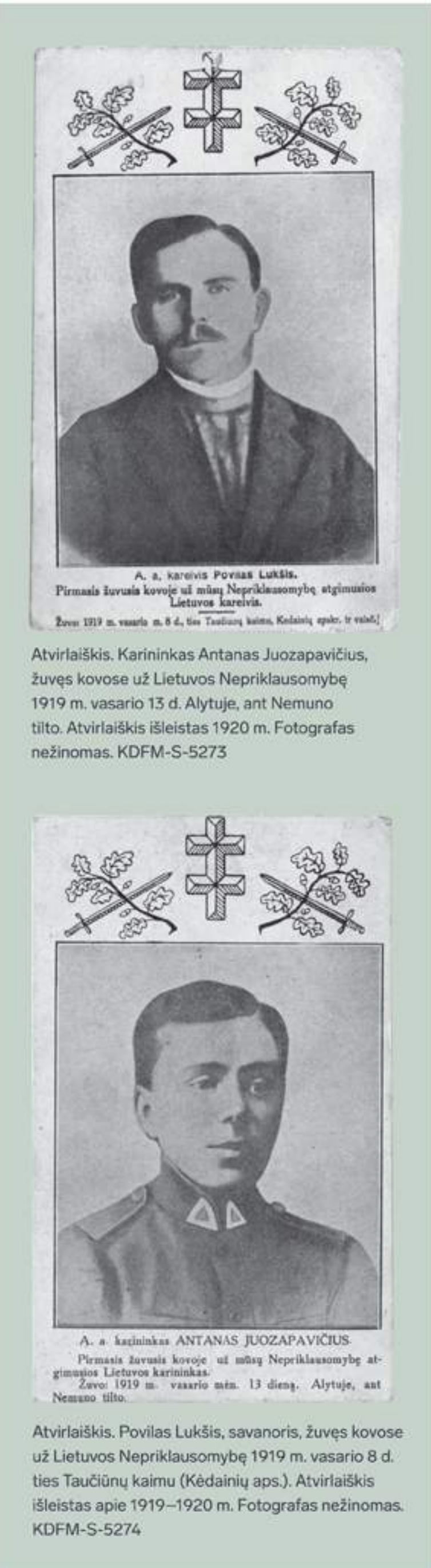
Atvirukė, Lietuvos Respublikos kariuomenės karininkai. Atvirukės išleistas apie 1919–1920 m. Fotografijos nešimas. KDFM-S-5276