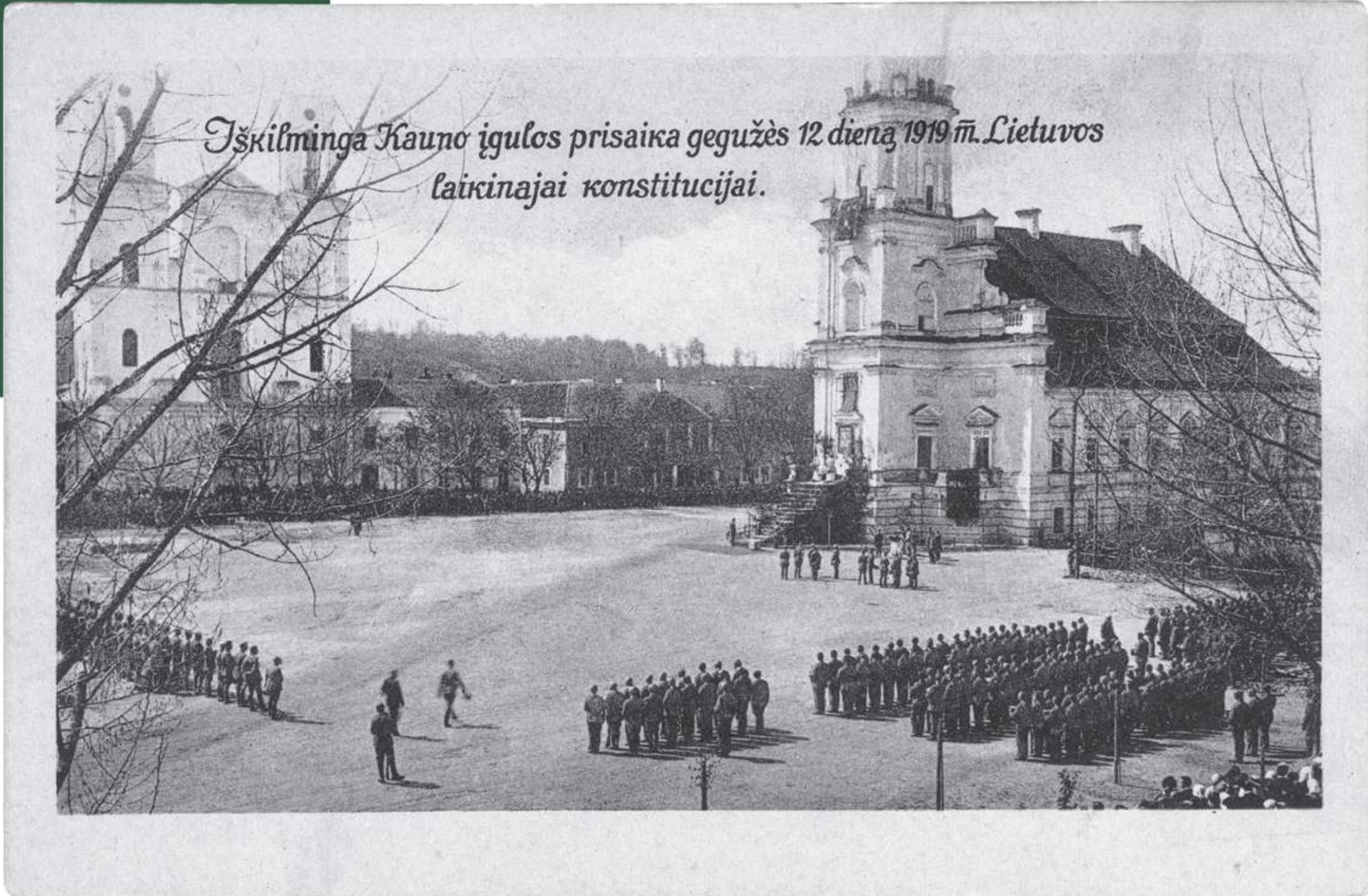
Atvirukė, šiluminė Kauno igulos prisaiška Lietuvos Respublikos Laikinąją Konstituciją, 1919 m. Atvirukės išleistas 1920 m. Fotografijos nešimas. KDFM-S-5275

1920 m. Tautų Sąjungos taikos delegacijos pirmininkas Lietuvos delegacijai pasakė: „Už savo tautos nepriklausomybę jūs turite būti dėkingi ne Ambasadorių konferencijai ir ne Tautų Sąjungai, bet tik savo narsiai kariuomenei.“