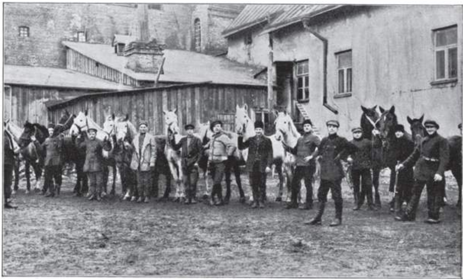
Atvirukė, Lietuvos Respublikos kavalerių būrys. Atvirukės išleistas 1920 m. Fotografijos nešimas. KDFM-S-6275