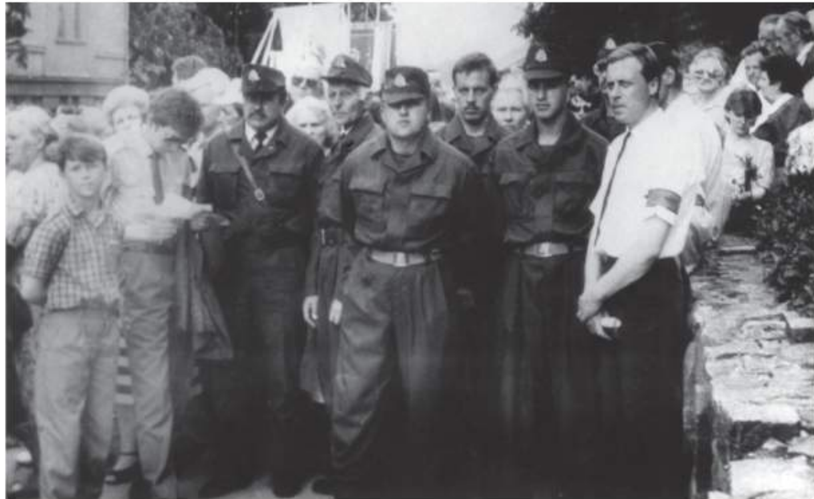
Telšių savanorių Rėgė 50-mečio minėjimo prie buvusio kaimelio. Telšiai, 1991 m. birželio 23 d. ŽAM F 5822