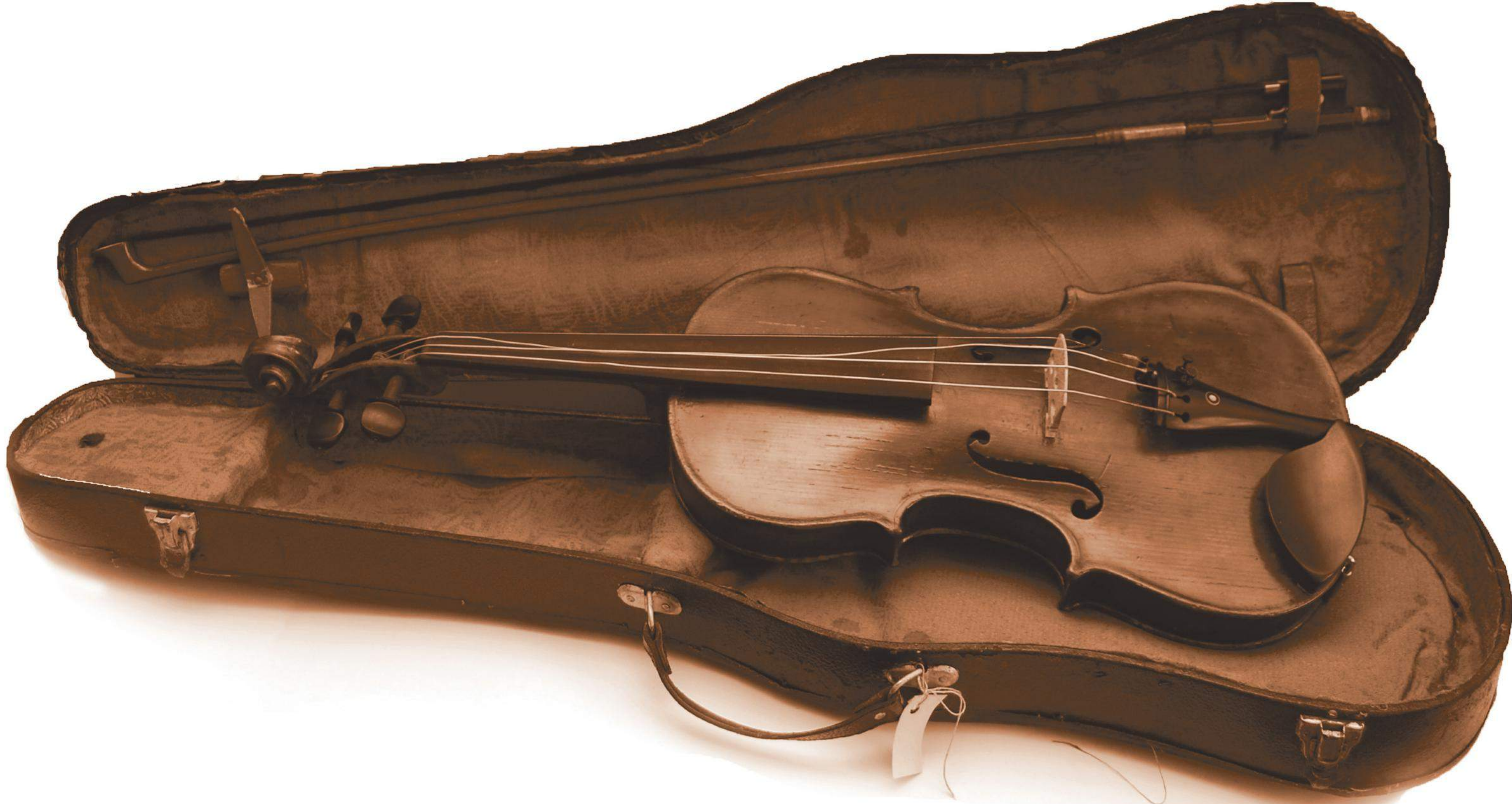
Vinco Kudirkos smuikas. Jau prieštarnas, tiktai, V. Kudirka 1898 m. sukūrė ir pirmą kartą atliko „Tautišką giesmę“. VKM 773