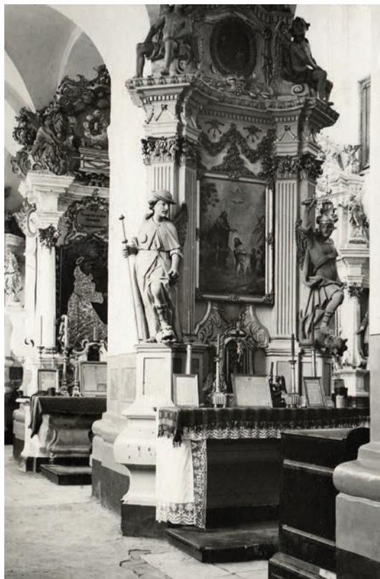
Jėzaus gimimo altorius Tytuvėnų bernardinų vienuolyno Švč. Mergelės Marijos bažnyčioje. Altoriaus retabulo pirmo tarpsnio centre, dekoratyviame gipsiniame aprėminime, įkomponuotas paveikslas „Jėzaus Krikštas“ (neiškilęs). 1931–1933 m.

7,6 x 3,9 cm. LDM Fi-2106/120.