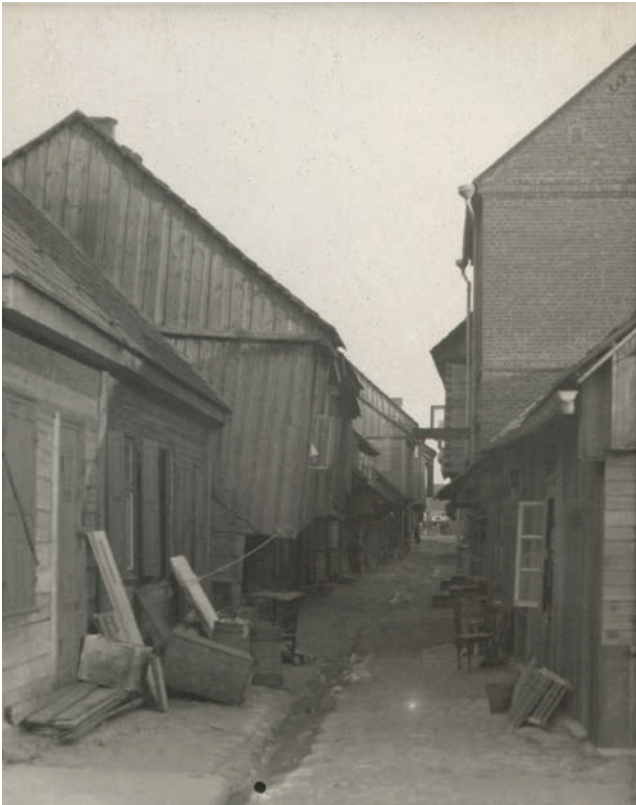
Žydų gatvelė Kelmėje. 1930–1935 m.

11,3 x 8,4 cm. LDM Fi-2107/99.