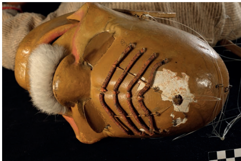
Marionetės Bjaurus tipas galva prieš restauravimą: ištrupėję viršugalvio grunto ir dažų sluoksniai.