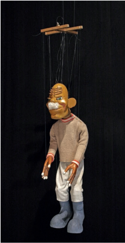
Restauruota marionetė Bjaurus tipas.