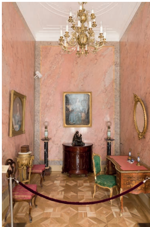
Grafiinės buduaras.