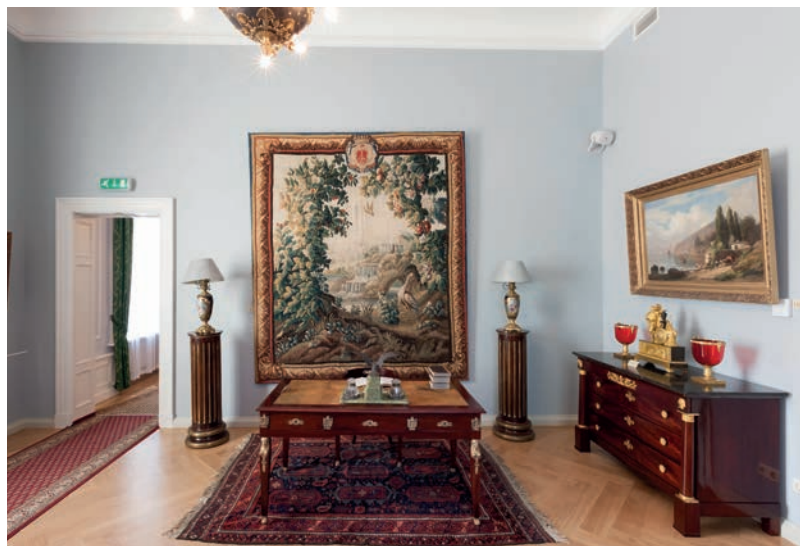
Restauruotų Palangos grafų Tiškevičių rūmų Jaunojo grafo kabinetas.