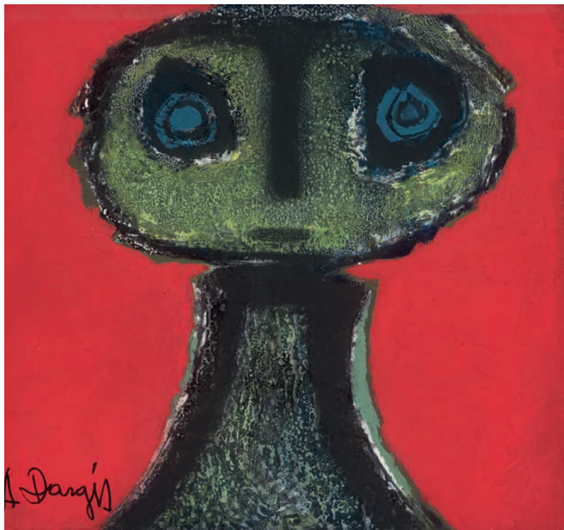
Alfonso Dargis. „Mergaitė“. 1985 m. Popierius, drobė, aliejus, mišri technika, 42,8 x 46 cm. LDM T 9351

deformacijos. Laikui bėgant formos eksperimentai gan laisvas elgimasis su žmogaus figūra tapo būdinga A. Dargio kūrybos savybe. 42