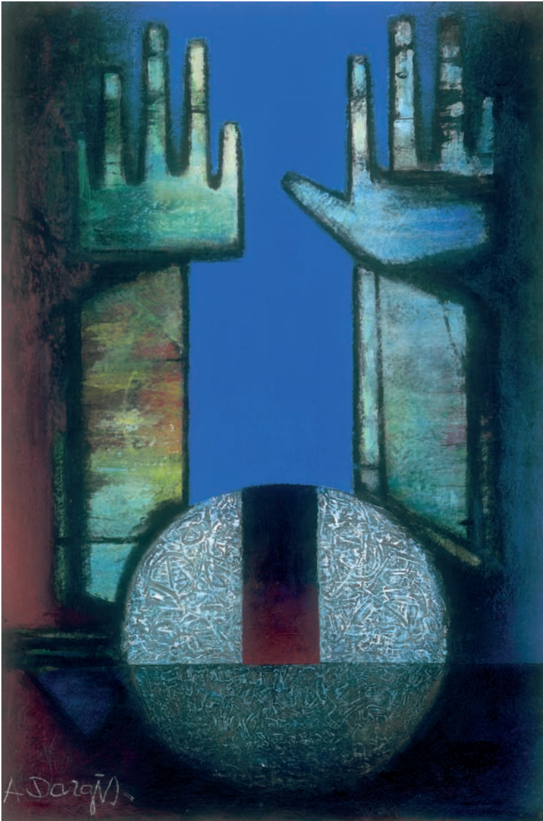
Alfonsas Dargis. „Europa“. 1985 m.

Popierius, drobė, aliejus, 92 x 61,5 cm. LDM T 9359