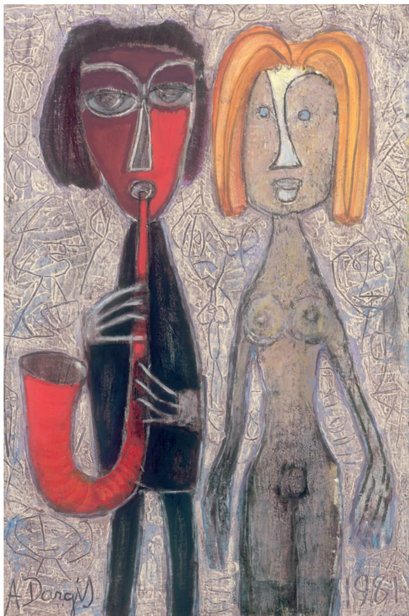
Alfonsas Dargis. „Pradžia“. 1981 m.

Drobė, aliejus, 89,8 x 58,8 cm. LDM T 9345